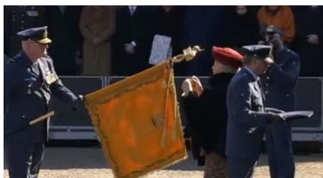
Краљица Беатрикс на „дјелу“

Он је подсетио да је краљица Холандије Беатрикс 27. марта 2013. одликовала Краљевско ратно ваздухопловство за бомбардовање Србије прије 14 година и на њихов барјак окачила врпцу с натписом "Косово 1999", те да су управо холандски авиони типа Ф-16МЛУ оборили први југословенски МиГ-29 који је полетео у сусрет НАТО бомбардерима.