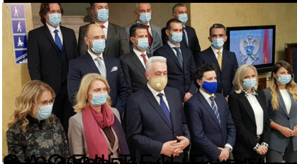
Борис Ђокић, министар енергетике, уочи отварања Националног центра за истраживање и развој у области енергетике