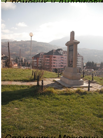
Споменик у Мојковцу