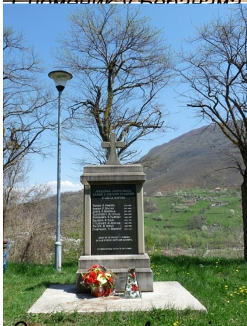
Споменик у Андријевици