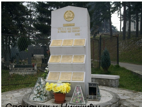
Споменик у Никшићу