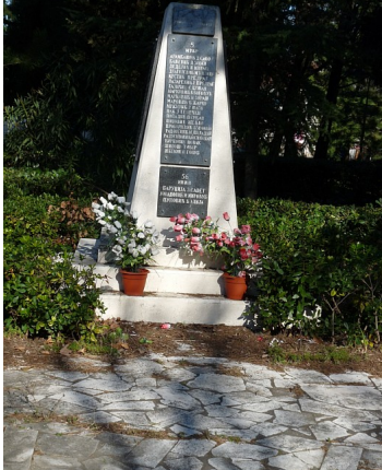
Споменици палим борцима Маслине