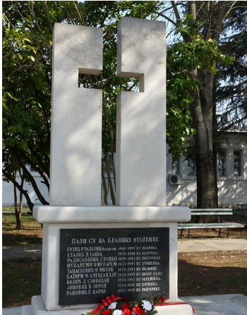
Споменици палим борцима Даниловград