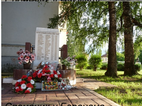
Споменик у Беранма